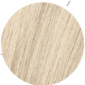
10.9 Beżowy róż