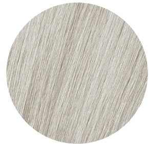
10.11 Popielate Srebro