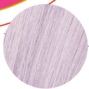
10.22 Chłodny Irys